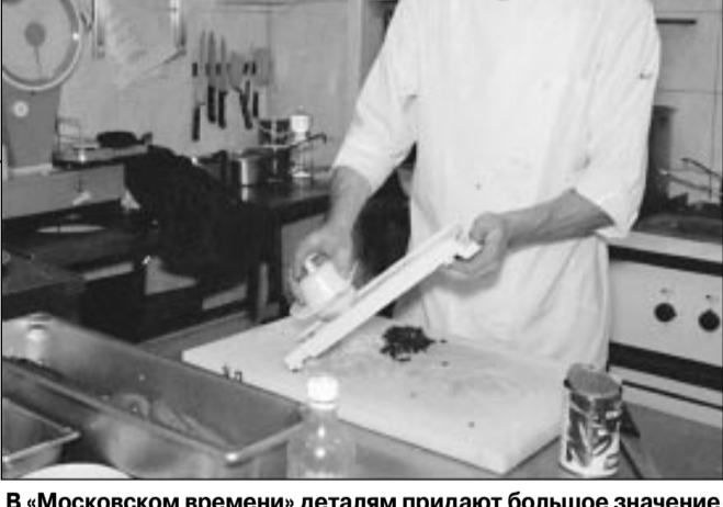
В «Московском времени» деталям придает большое значение

Музыкальная программа и круг посетителей еще не сложились. Когда выступают неплохие группы («НТО Рецент») — народу слишком много, когда хорошие, но неизвестные коллективы («Веселые картинки») — пусто.